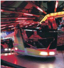
RUNDT OG RUNDT: Det svinger påmart'n.